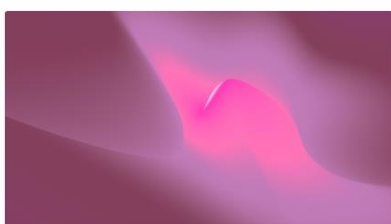
Objektorientierte Programmierung in Java - Schulversion